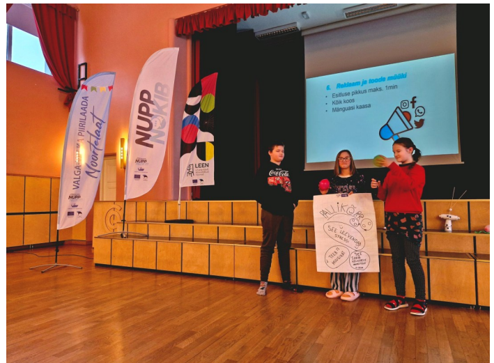
Hargla Kooli õpilased oma tooteid tutvustamas